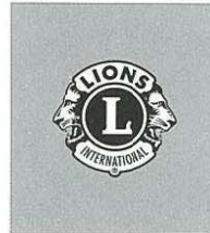
Hao Chiang D 300 G2