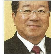
Yuichi Tsunoda D 332 E