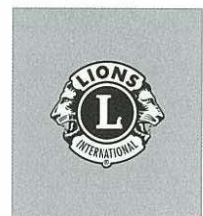
Charlie Torres D 301 C