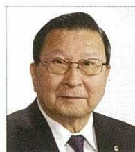
Toshiatsu Kato D 333 A